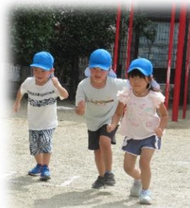
フープめがけてジャンプ!