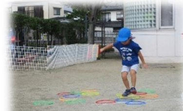
ケンケンパーのリズム、上手になりました!

運動会を楽しみにしているぞう組の子どもたち。苦手だった鉄棒に何度もチャレンジして前回りができるようになったり、目標めがけてジャンプしたりとできることが増えてきました。また、かけっこで負けても泣く姿はなく『今度は頑張る!』と前向きな言葉が聞かれるなど一人一人が運動会に向けて強い気持ちを感じられます。